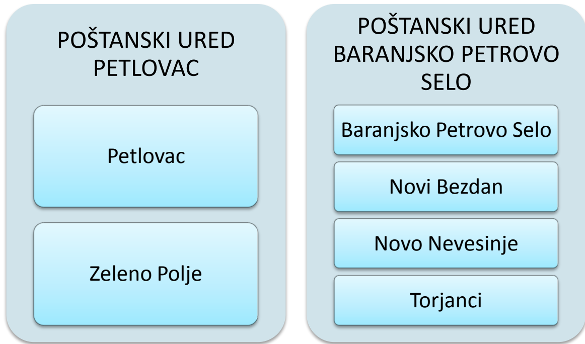
Slika 2.: Poštanska mreža Općine

Naselja Luč, Sudaraž i Širine teritorijalno pripadaju Općini Petlovac, ali organizacijski Gradu Beli Manastir.