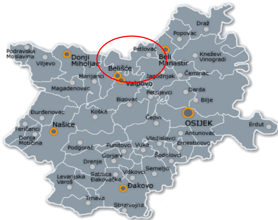
Slika 1.: Položaj Općine Petlovac u Osječko-baranjskoj županiji

Cestovni promet je grana prometa preko koje prostor Općine ostvaruje veze s užim i širim okruženjem i to putem trasa dviju državnih ceste: D517 i D211. Izgradnja mosta preko rijeke Drave kod Belišća značajno je poboljšala prometnu prohodnost prostora, a izgradnjom buduće autoceste u koridoru Vc područje prostora Općine dobit će kvalitetan pristup na prometnu mrežu europskih autocesta.